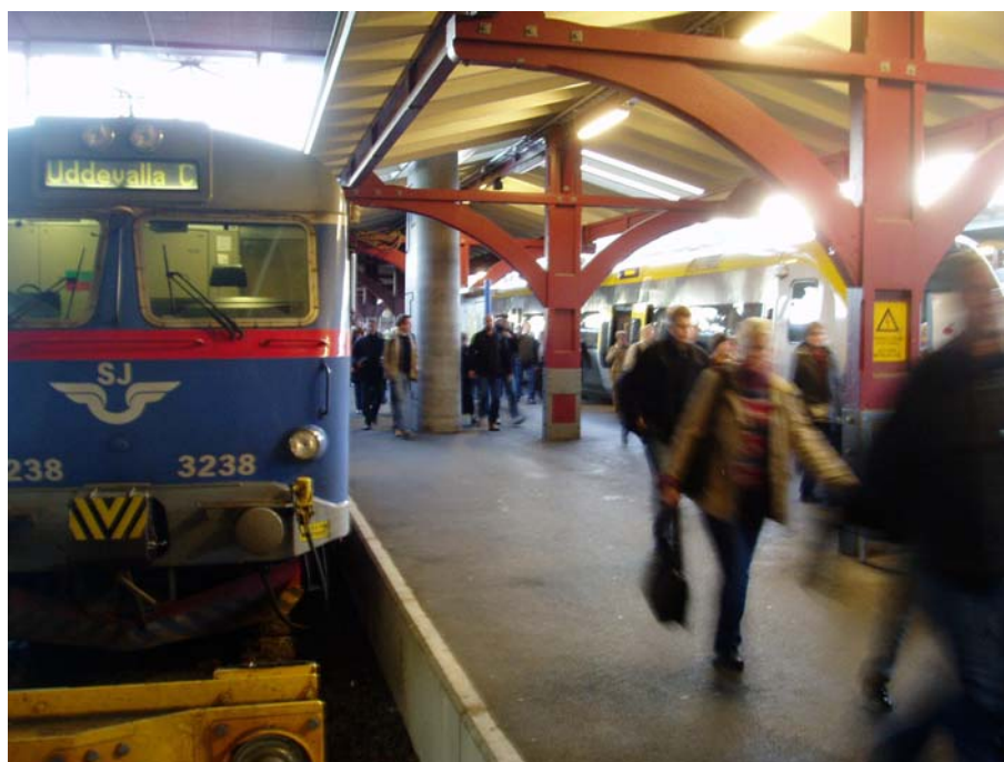
Regionala ägarrådet 2005

AV ARBETET I ÄGARRÅDEN FÖR KOLLEKTIVTRAFIKEN I VÄSTRA GÖTALANDSREGIONEN